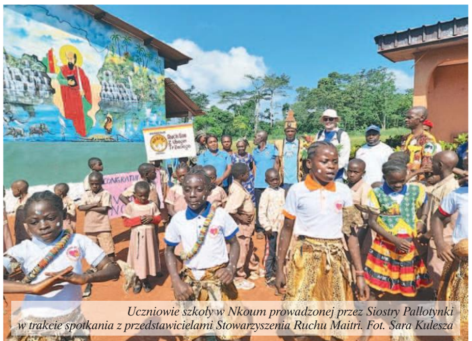
Uczniowie szkoły w Nkoum prowadzonej przez Siostry Pallotynki w trakcie spotkania z przedstawicielami Stowarzyszenia Ruchu Maitri.

Poprzez ten list dziękuję każdemu, kto pomaga naszym maluchom w ich codziennym dożywianiu w przedszkolu. Dziękuję