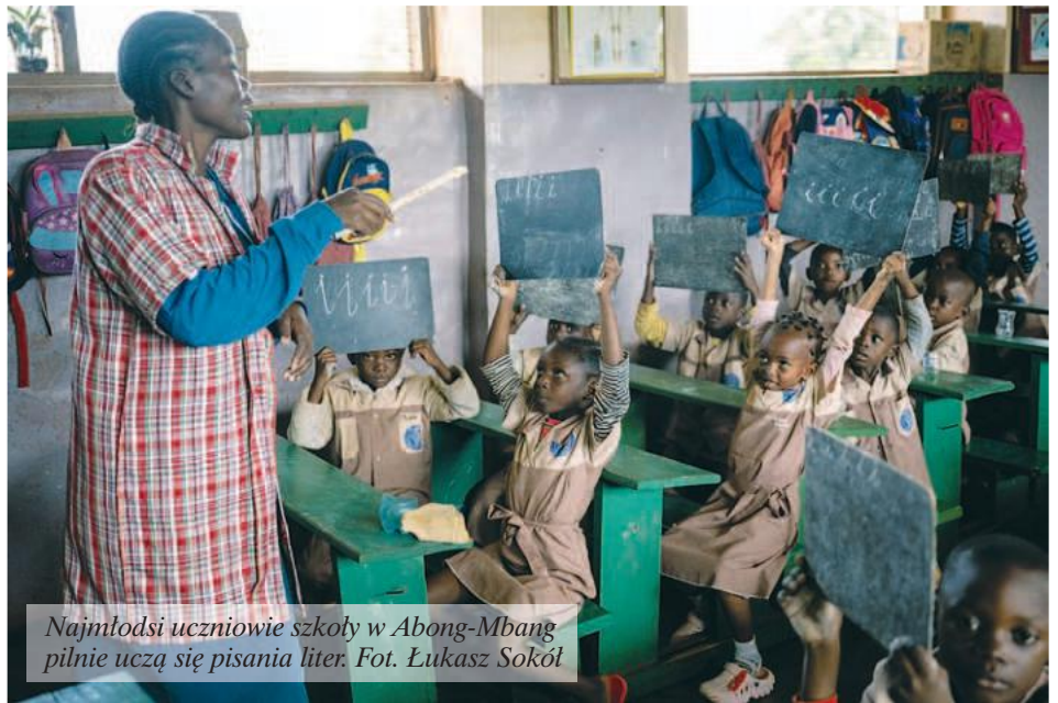
Najmłodszy uczniowie szkoły w Abong-Mbang pilnie uczą się pisania liter.