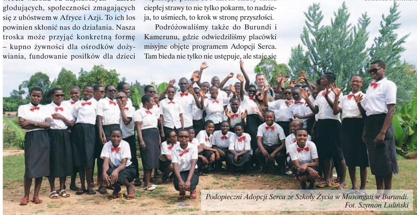
Podopieczni Adopcji Serca ze Szkoły Życia w Musongati w Burundi.