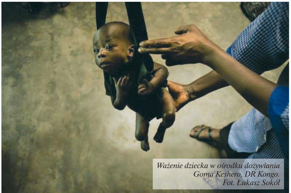
Ważenie dziecka w ośrodku dożywiania Goma Keshero, DR Kongo.